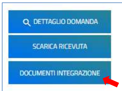
Figura 3 – Pulsante per accedere al caricamento

Cliccando sul dettaglio, l'utente visualizzerà il pulsante per accedere alle funzionalità disponibili per il caricamento della documentazione richiesta (Figura 3 – Esempio Integrazioni).