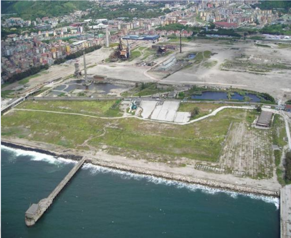
Caratterizzazione integrativa Colmata e Arenili

TITOLO INTERVENTO: «Accordo quadro per l'affidamento di servizi di analisi di laboratorio, indagini e sondaggi nel SIN di Bagnoli – Coroglio»