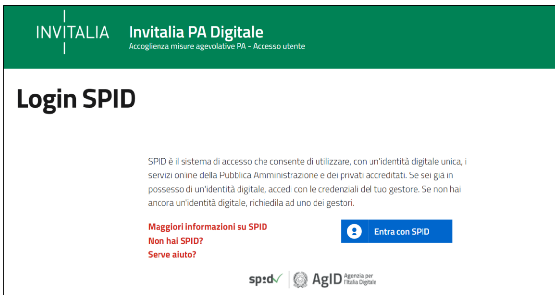
Figura 1 – Pagina di Login SPID

Per accedere alla piattaforma di presentazione delle domande occorre collegarsi al link https://sso-padigitale.invitalia.it/Account/Login e utilizzare il sistema pubblico di identità digitale SPID per effettuare l'accesso.